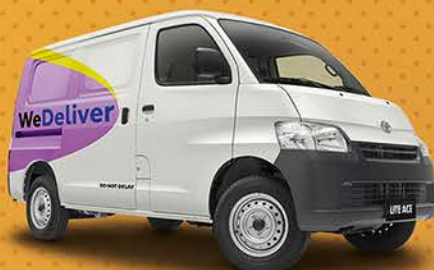
LOGISTICS/ E-COMMERCE DELIVERY